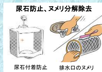
尿石防止、ヌメリ分解除去